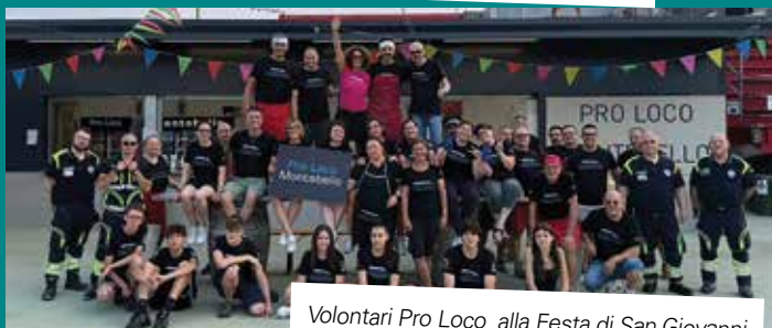
Volontari Pro Loco alla Festa di San Giovanni