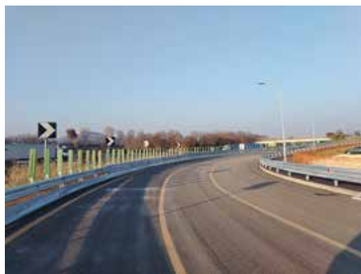
La nuova strada di collegamento tra viale Stazione e via Contrada Fara

Sono ormai in dirittura d'arrivo le opere complementari alla realizzazione della nuova linea ferroviaria Alta Velocità/Alta Capacità . Manca poco, infatti, alla consegna al Comune della nuova strada che, tramite un sottopasso, collega viale Stazione con il nuovo grande parcheggio a sud della stazione e, da lì, con via Contrada Fara. Anche il parcheggio , che sarà dotato di 330 posti, alcuni dei quali riservati ai pullman, è in fase di ultimazione. Nel frattempo, è stato aperto un parcheggio provvisorio per ovviare alla carenza di posti auto nell'area antistante alla stazione. Su richiesta dell'Amministrazione comunale, il Consorzio Iricav 2 (esecutore dei lavori TAV), ha messo a disposizione una zona proprio a fianco della nuova strada. I pendolari e tutti gli altri viaggiatori possono utilizzarla e poi raggiungere la stazione tramite un percorso pedonale. Lo scopo principale era l'eliminazione del problema della sosta selvaggia, dovuto al massiccio afflusso alla stazione di studenti e pendolari.