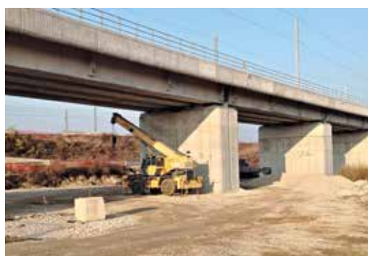
Una delle aree di cantiere