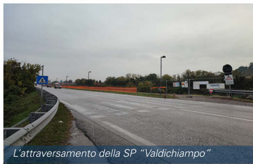
L'attraversamento della SP "Valdichiampo"