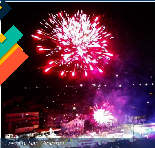
Festa di San Giovanni