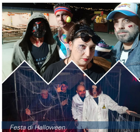
Festa di Halloween