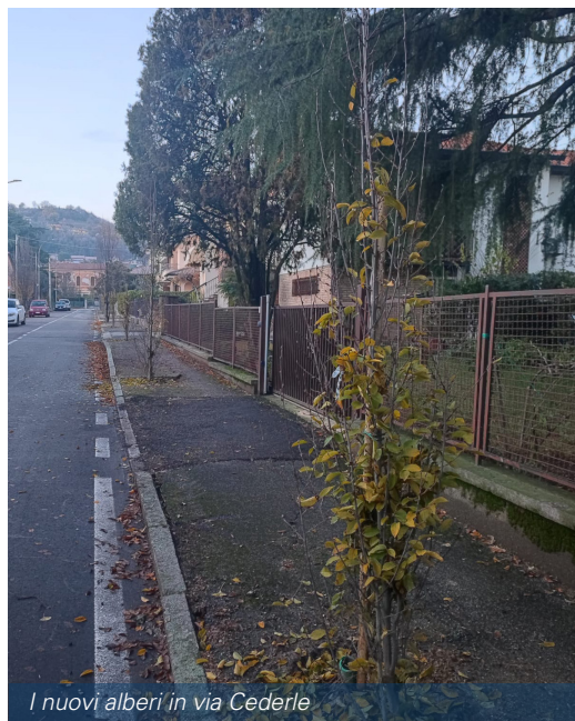
I nuovi alberi in via Cederle

Per i due interventi, il Comune ha stanziato 50.000 euro, che comprendono anche la sistemazione del marciapiede di via Cederle nei punti in cui era stato danneggiato dall'affioramento delle radici degli alberi.