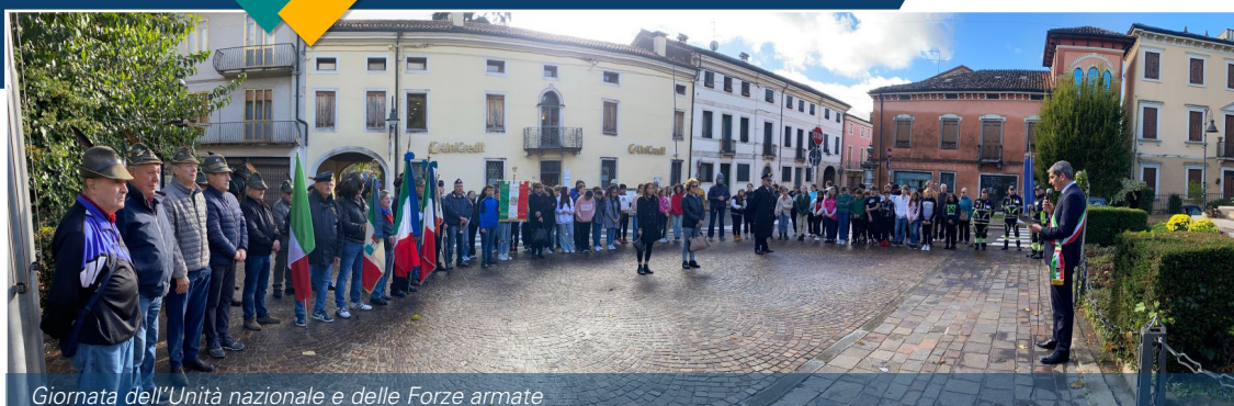
Giornata dell'Unità nazionale e delle Forze armate