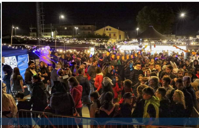
Festa di San Giovanni