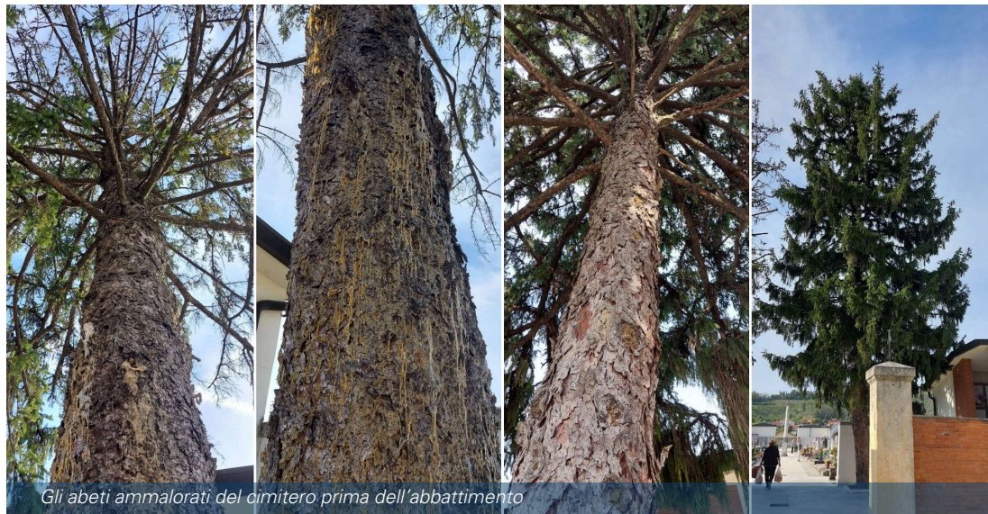
Gli abeti ammalorati del cimitero prima dell'abbattimento