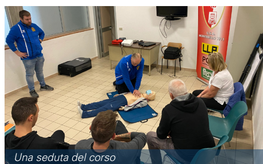
Una seduta del corso

nizzato due incontri sull'uso del defibrillatore , che hanno richiamato l'attenzione di oltre 50 persone. Il primo incontro si è tenuto il 15 ottobre. Era un corso di retraining, ovvero di rinnovo, per l'uso dell'apparecchiatura salvavita. Il secondo si è svolto il 29 ottobre ed è stato un vero e proprio primo corso riservato a chi ancora non sapeva utilizzare il defibrillatore. Il corso era aperto alle società sportive di Montebello e Gambellara e vi hanno partecipato anche i volontari della Pro Loco di Montebello. Il successo di questi incontri, riscontrato in una partecipazione attiva da parte dei cittadini, dimostra quanto le persone vogliano mettersi in gioco sia per cultura personale e sia per essere a disposizione del prossimo in caso di necessità.