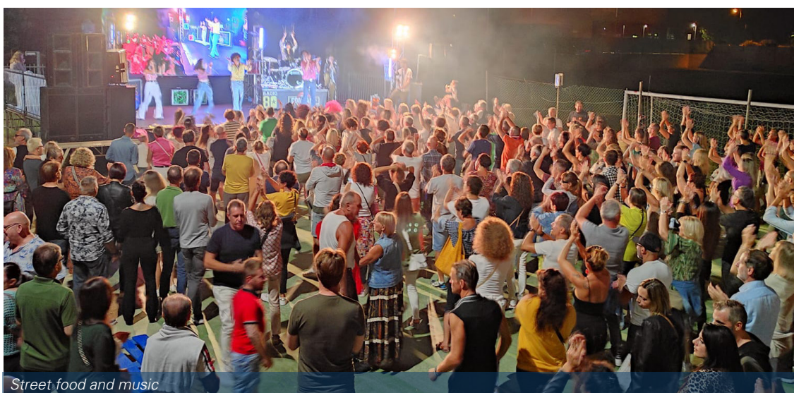
Street food and music