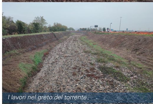
I lavori nel greto del torrente