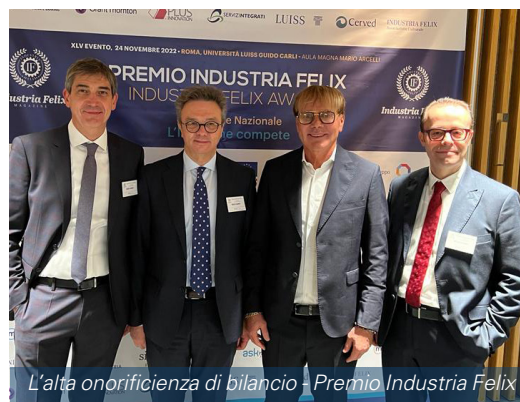
L'alta onorificenza di bilancio - Premio Industria Felix

Un percorso virtuoso e un esempio concreto di sostenibilità riconosciuto anche a livello nazionale. Per il secondo anno consecutivo, infatti, Università Luiss di Roma e Il Sole 24 Ore hanno premiato Medio Chiampo con l' Alta onorificenza di Bilancio per competitività, performance gestionali, affidabilità finanziaria e sostenibilità .