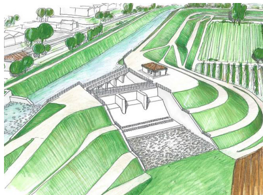
La presa vista dall'interno della cassa di espansione

L'ampliamento dell'estensione del bacino è previsto di 17 ettari, accompagnato da una serie di interventi ed opere collaterali.