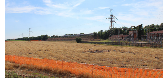
L'area del futuro prolungamento di viale Stazione

Attualmente l'ingresso alla stazione ferroviaria avviene attraverso l'incrocio a raso tra la Strada Regionale 11 e viale Stazione. Qui verrà realizzata una rotatoria , che renderà meno pericolosa l'intersezione. Viale Stazione, all'altezza della curva, verrà prolungata verso sud, tramite un sottopasso alla linea ferroviaria, per raggiungere il nuovo parcheggio da 300 posti che sarà realizzato sotto i piloni del tratto sopraelevato della TAV. Il tratto di viale Stazione che attualmente, passando davanti alla stazione stessa, va verso Contrada Frigon, sarà chiuso al traffico e sarà percorribile solo dai mezzi agricoli e dai frontisti.