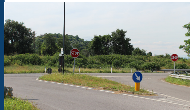
L'incrocio tra SR11 e viale Stazione

Quali opere accessorie porta in dote il passaggio a Montebello Vicentino della linea ferroviaria ad alta velocità e alta capacità ? Sono numerose ed hanno a che fare soprattutto con il miglioramento di alcune criticità locali della viabilità. A chiederle il Comune di Montebello Vicentino, che ha così ottenuto importanti compensazioni rispetto all'insediamento, in un terreno agricolo situato tra la A4 e la linea ferroviaria in via Contrada Ronchi, del grande campo base per i circa 300 operai che si occuperanno della realizzazione dell'opera nel tratto che va da Montebello a Vicenza e rispetto all'abbattimento, purtroppo, di alcuni edifici. Ecco, dunque, le opere più significative.