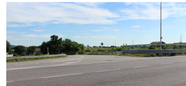
L'incrocio tra SR11 e via Contrada Ronchi

Un'altra criticità che verrà risolta è rappresentata dall'incrocio a raso tra la SR11 e via Contrada Ronchi. Anche qui verrà realizzata una rotatoria : soluzione importantissima se si pensa ai numerosi passaggi dei mezzi di cantiere che avverranno quando il campo base, situato proprio in via Contrada Ronchi, diverrà operativo.