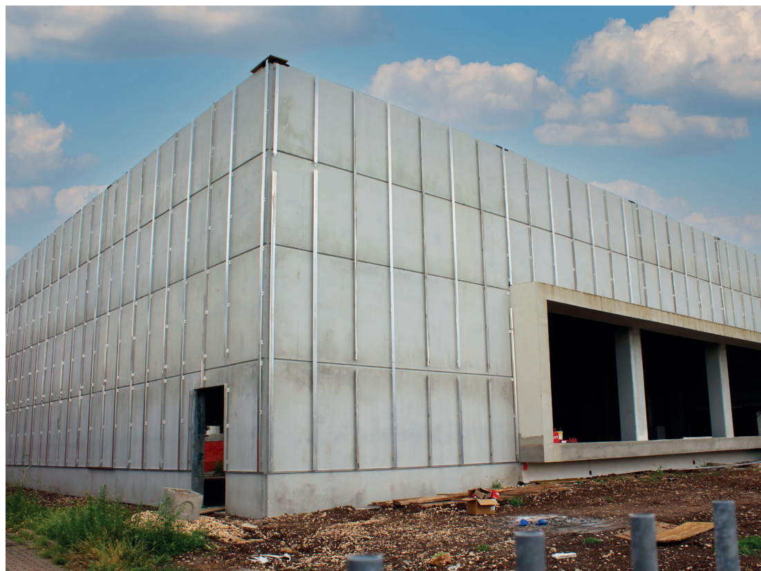
Il cantiere della nuova palestra

Per la ritinteggiatura della sala mensa della scuola primaria sono stati stanziati 5.000 euro, mentre 6.000 euro sono destinati all'acquisto di computer per favorire lo smartworking dei dipendenti comunali e altri 6.000 all'acquisto di nuovi programmi informatici per la produzione dei certificati digitali dell'ufficio anagrafe.