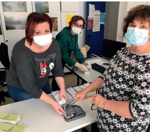
La preparazione dei buoni spesa

A tutto questo, si aggiungono ulteriori 18.000 euro per il trasporto scolastico , il cui costo è aumentato a causa dell'utilizzo di un maggior numero di pulmini, sempre dovuto al rispetto delle norme sul distanziamento sociale.