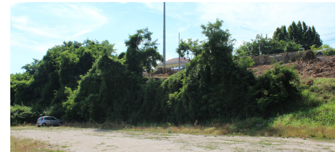
L'area del futuro parcheggio da 300 posti

La stazione sarà oggetto di un intervento di ammodernamento generale. In particolare, il tunnel pedonale che porta ai binari sarà prolungato verso sud per raggiungere il nuovo parcheggio, al quale sarà collegato anche tramite due ascensori, allo scopo di eliminare le barriere architettoniche.