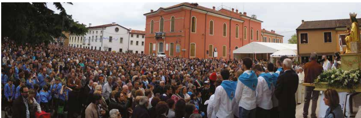
La Solenne del 2015

U na disdetta storica. Per la prima volta dalla sua istituzione, nel lontano 1885, non è stata celebrata la festa quinquennale della Solenne . Giunta alla 27esima edizione, avrebbe dovuto svolgersi, come da tradizione, dall'1 al 4 maggio, in occasione della prima domenica del mese. Nonostante la delusione per l'annullamento di un evento per il quale erano già partiti i preparativi, con i comitati frementi e le strade pronte ad essere addobbate, l' Unità Pastorale di Montebello è già al lavoro per rinviare la festività a domenica 4 ottobre, in occasione della festa della Madonna del Rosario.