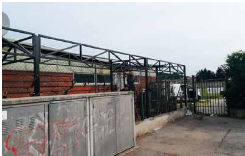
Sotto, l'area della cucina Pro Loco