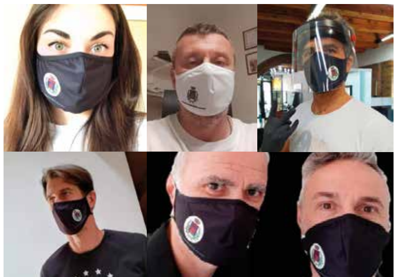
Sopra, le mascherine griffate Comune di Montebello

500 le mascherine griffate con lo stemma del Comune vendute invece dalla Pro Loco : il ricavato di 750 euro è stato impiegato per saldare i lavori di ampliamento della cucina nell'area gestita dall'associazione.