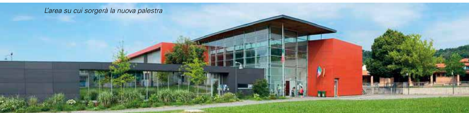
L'area su cui sorgerà la nuova palestra

La superficie interna permetterà di tracciare un campo regolamentare per il basket, al cui fianco sarà realizzata una tribuna a tre gradoni. L'altro corpo dell'edificio prevede la creazione di tre spogliatoi (uno femminile, uno maschile e uno per gli arbitri), due bagni adattati anche per i diversamente abili, un'infermeria e un