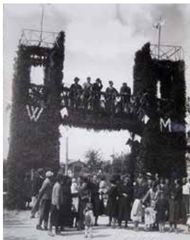
La Solenne del 1935

Per l'occasione sono invitati tutti i sindaci della vallata, e fanno ritorno in paese tutti gli "oriundi" montebellani sparsi in giro per il mondo: insomma, un appuntamento troppo importante per essere cancellato , motivo per cui, Covid permettendo, ci si ritroverà tutti ad ottobre.