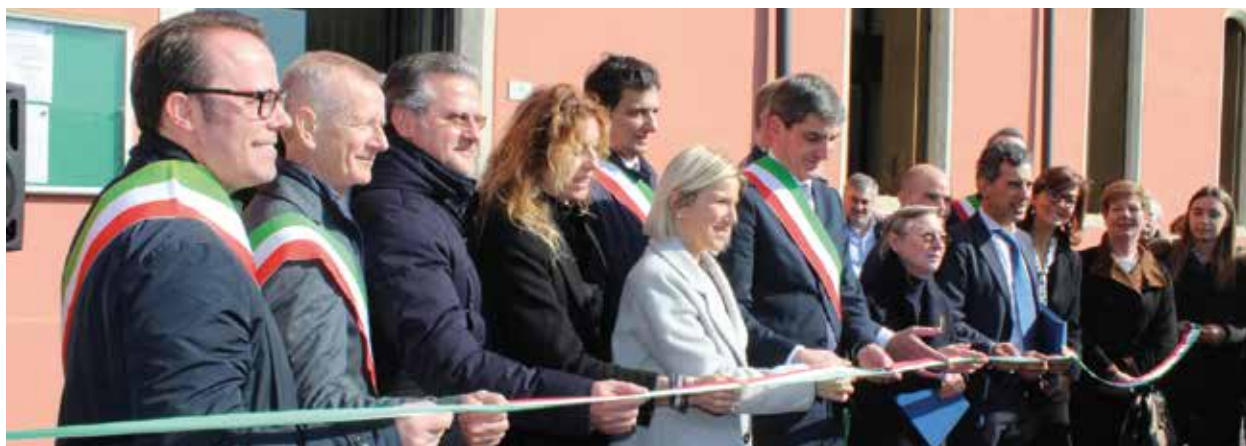
L'inaugurazione della nuova Medicina di Gruppo alla vigilia dell'esplosione dell'emergenza Coronavirus

«Per Montebello è una grande notizia – afferma il sindaco di Montebello Vicentino e Presidente della Conferenza dei Sindaci dell'Ulss 8 Dino Magnabosco -. Se ne parlava da anni e finalmente questo obiettivo è stato raggiunto. Ringrazio l'Ulss 8 e i medici che hanno dato la loro disponibilità ad avviare questo servizio, il quale rappresenta veramente un salto di qualità per la sanità pubblica territoriale. I cittadini avranno infatti un punto d'appoggio qualificato, capace di erogare nuove prestazioni e aperto tutti i giorni feriali».