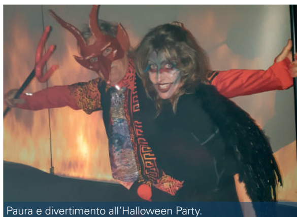
Paura e divertimento all'Halloween Party.