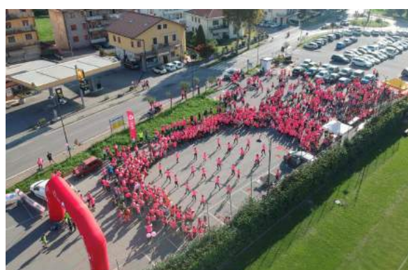
Montebello cammina in rosa e la consegna alla Lilt del ricavato della manifestazione.