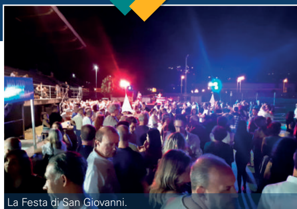
La Festa di San Giovanni.