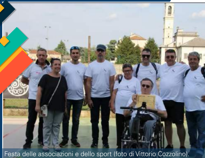
Festa delle associazioni e dello sport.