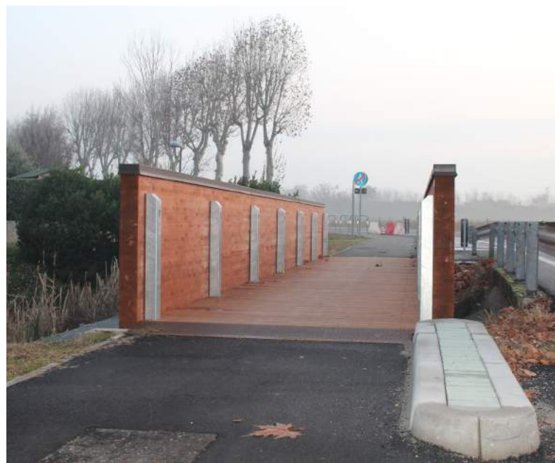
Sopra, il ponte della nuova ciclabile.

L'opera pubblica, sostenuta da una spesa di 380.000 euro, consente di completare l'anello comunale per la mobilità sostenibile. Permette, infatti, non solo di collegare in tutta sicurezza (anche di notte grazie all'illuminazione con luci a led) le piste già esistenti in via Borgolecco e viale Verona, ma anche di fare da punto di giunzione tra la rete comunale e quella interprovinciale sull'asse Verona – Vicenza, per la quale è in fase di prossima realizzazione il tratto lungo il Chiampo tra il Ponte Novo e Gambellara.