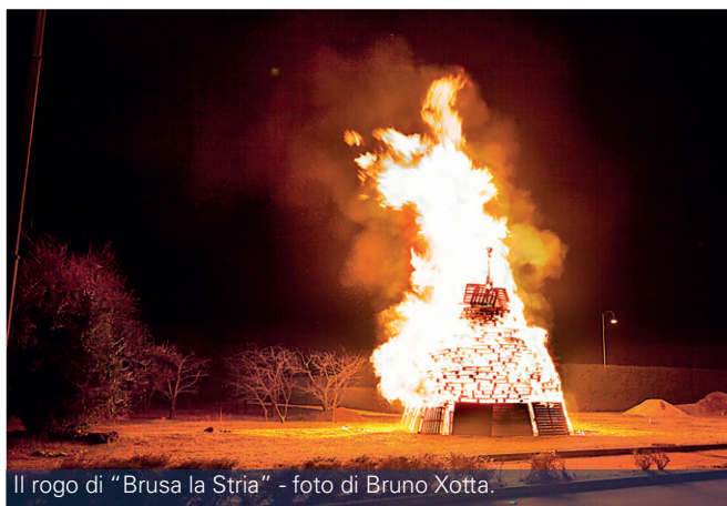
Il rogo di "Brusa la Stria" - foto di Bruno Xotta.