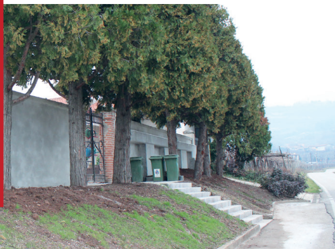
Il nuovo aspetto del cimitero di Selva dopo i lavori per la messa in sicurezza.