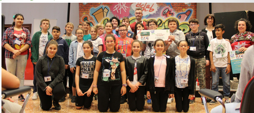
1 a A della scuola secondaria di primo grado

Titolo e trama sono al momento top secret, ma presto saranno svelati!