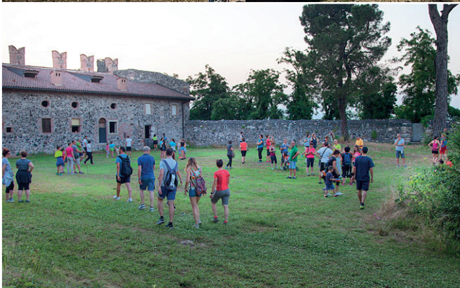
Prima "Lucciolata al Castello" - foto di Bruno Xotta.