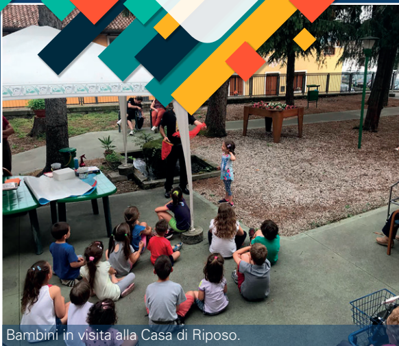
Bambini in visita alla Casa di Riposo.