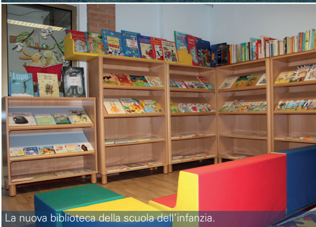
La nuova biblioteca della scuola dell'infanzia.