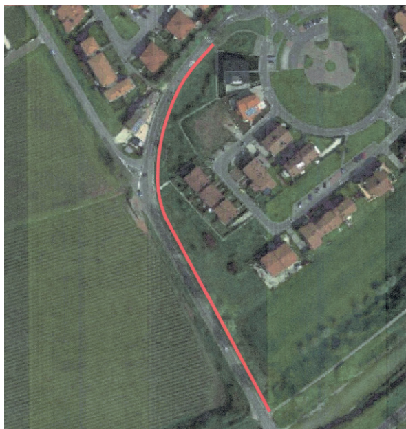
La nuova pista ciclabile lungo viale Verona.

Il Comune di Montebello è conscio delle grandi potenzialità che una rete di piste ciclabili ha per il territorio. Nel 2017 è stato realizzato il primo stralcio della pista lungo via Mira e il prossimo intervento in programma è completare il secondo stralcio che consiste nella realizzazione dell'ultimo tratto di pista che costeggerà la parte terminale di viale Verona fino al Ponte Novo, sul torrente Chiampo. Verrà realizzato un attraversamento pedonale prima della rotatoria di viale Verona e una piccola passerella in legno sul ponte dove il tratto incrocerà la pista che scende sull'argine del Chiampo.