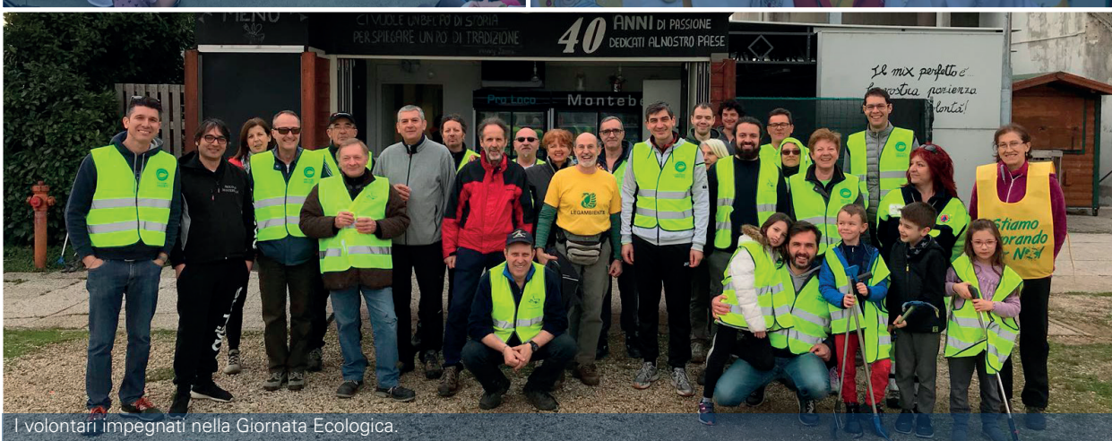
I volontari impegnati nella Giornata Ecologica.