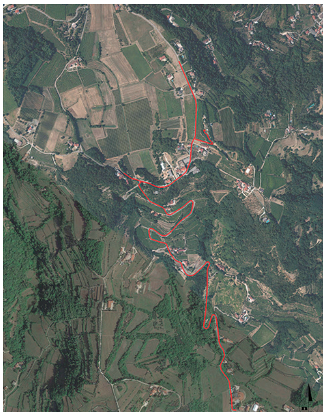
Il tratto interessato dai lavori.

La previsione è che i lavori vengano completati entro l'estate 2019.