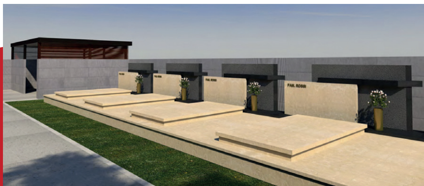
Nuovi loculi, tombe di famiglia e cappelle di famiglia nel cimitero del capoluogo.