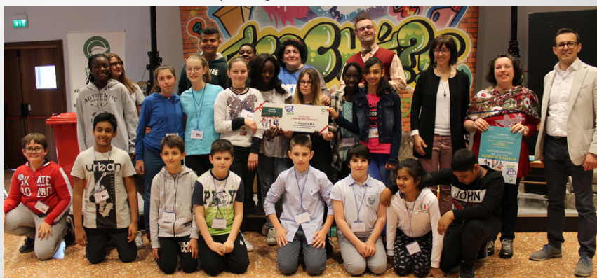
1 a B della scuola secondaria di primo grado