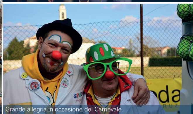
Grande allegria in occasione del Carnevale.