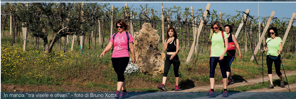
In marcia "tra vigne e olivari" - foto di Bruno Xotta.